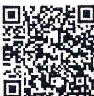
หนังสือที่อ้างถึง